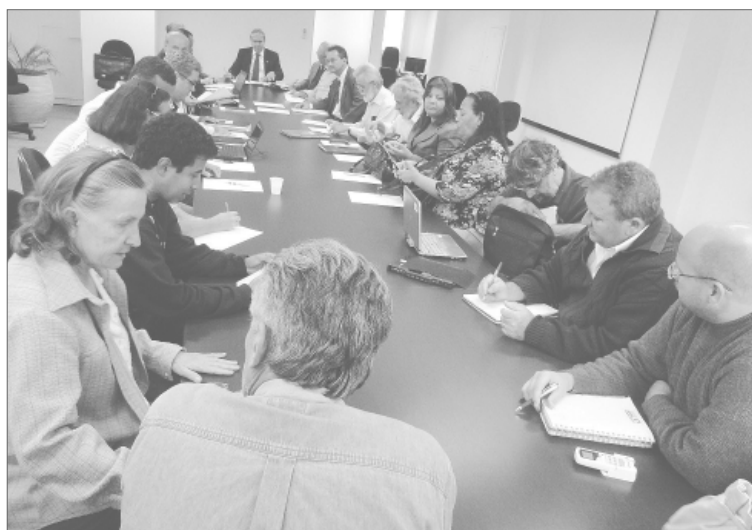
A segunda negociação da data-base 2011

Usando os mesmos indicadores do ano passado (inflação/crescimento do PIB/média de arrecadação dos últimos 10 anos), o Fórum projeta uma arrecadação de, no mínimo, R$ 74 bilhões para 2011. Feitas as contas, o Fórum detecta que é possível aos reitores darem, pelo menos, 12% de reajuste para todos + 6% para os funcionários. Isso manteria o comprometimento com folha de pagamento em, aproximadamente, 85%. Essa contraproposta foi apresentada durante a negocia-