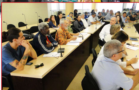
A reunião entre representantes do Fórum das Seis e a presidente do Cruesp

mais verbas para as universidades na LDO-2015 ( veja matéria a seguir ), a presidente do Cruesp relatou algumas iniciativas tomadas – reuniões com a Comissão de Finanças, Orçamento e Planejamento (CFOP), da Assembleia Legislativa (Alesp), e com membros do governo – para defender a mesma proposta do Fórum das Seis em relação ao repasse do ICMS sem expurgos. Segundo ela, até aquele momento, o governo havia concordado apenas em inserir no relatório da CFOP a expressão “no mínimo” antes do percentual de 9,57% do ICMS.