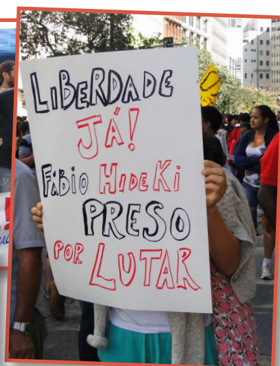
Em meio aos atos, destaque para a luta pela imediata libertação de Fábio Hideki, servidor e funcionário da USP, preso ilegalmente pela PM durante ato em São Paulo, no dia 23/6

A GREVE CONTINUA! NÃO É SÓ POR REAJUSTE! É POR DIGNIDADE E DEMOCRACIA!